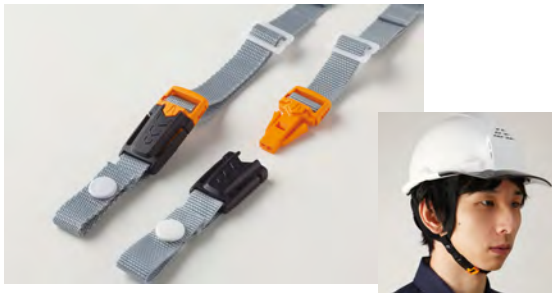
既存のヘルメットに付け替えることができるあご紐。

普段は通常のバックルとして、緊急時にはホイッスルとして使えます。 常にヘルメットを使う現場仕事の人には最適。