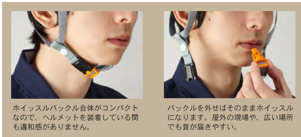
ホイッスルバックル自体がコンパクトなので、ヘルメットを装着している間も違和感がありません。